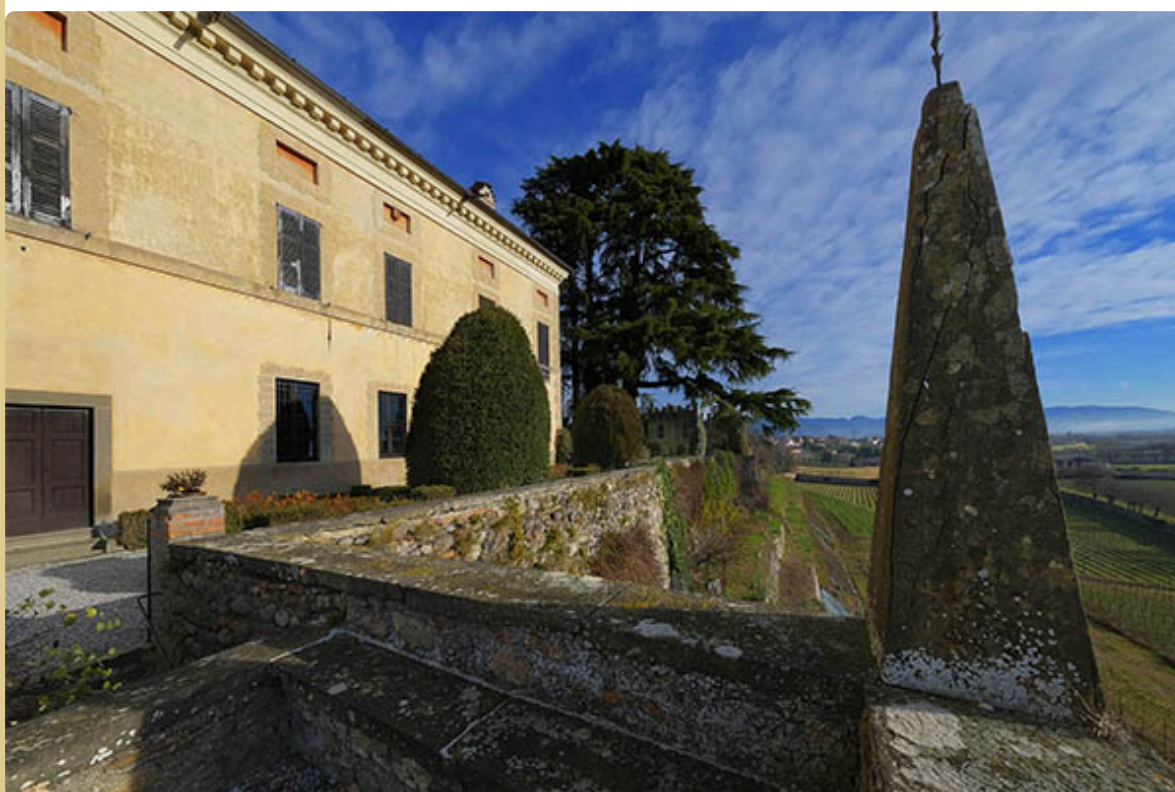
la cinquecentesca Villa Orlando