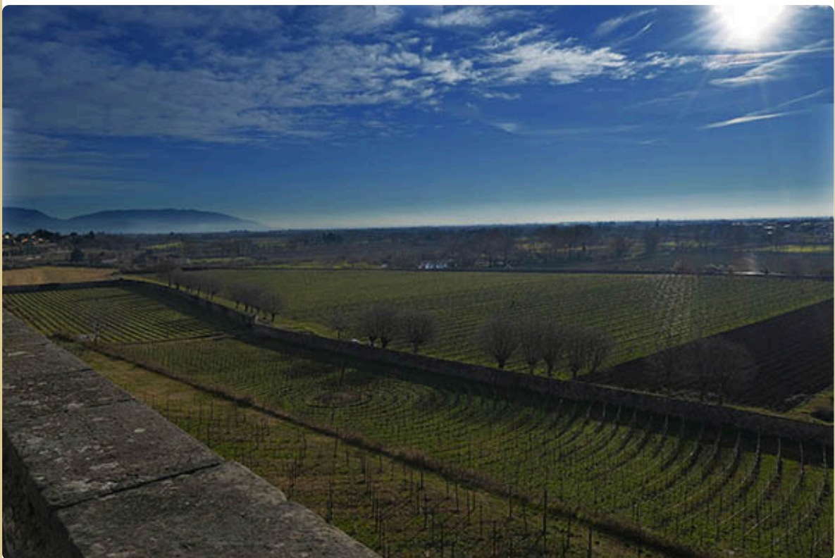
il brolo e la bredda del Castello con i vigneti biologici