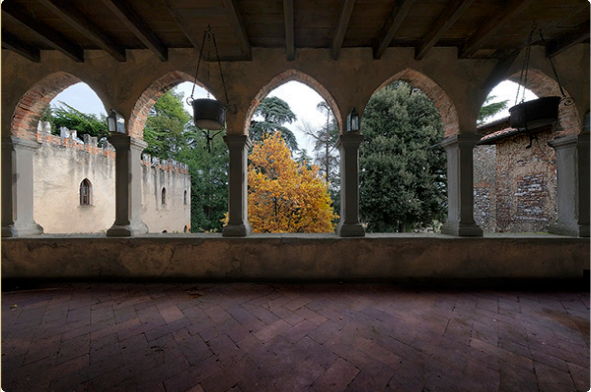
il loggiato del piano nobile