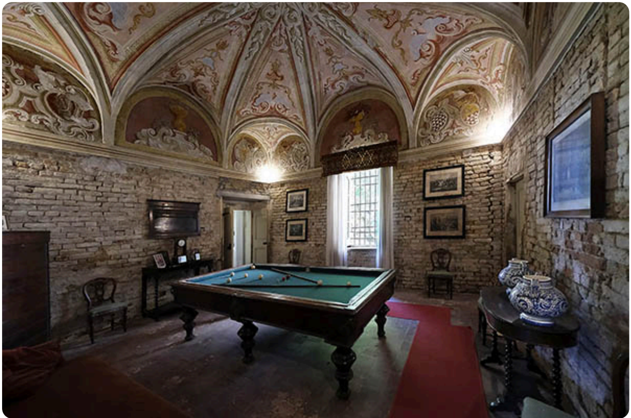
la sala del biliardo