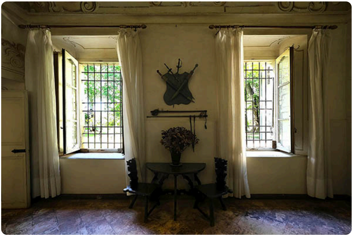
un angolo del Piano Nobile