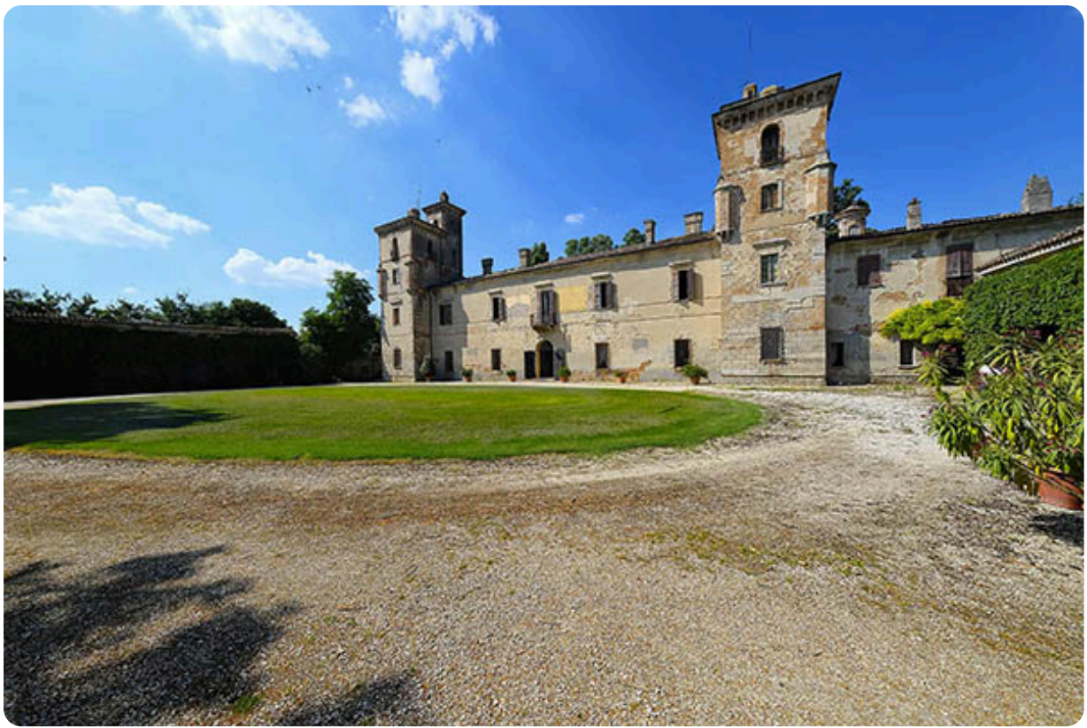
Casteldidone, Cremona, il Castello Mina della Scala