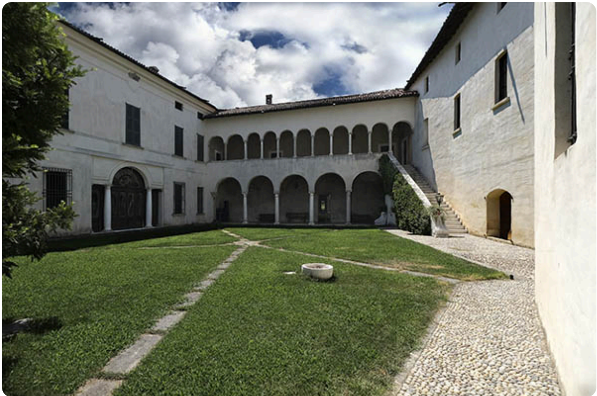
Meano di Corzano, Brescia, Castello Avogadro

https://www.castelli-fantasmileggende.it/meano.html