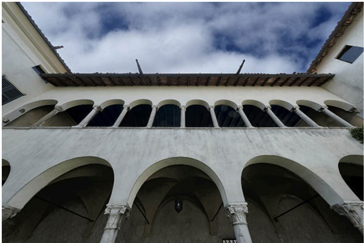
Meano, il loggiato del corpo centrale